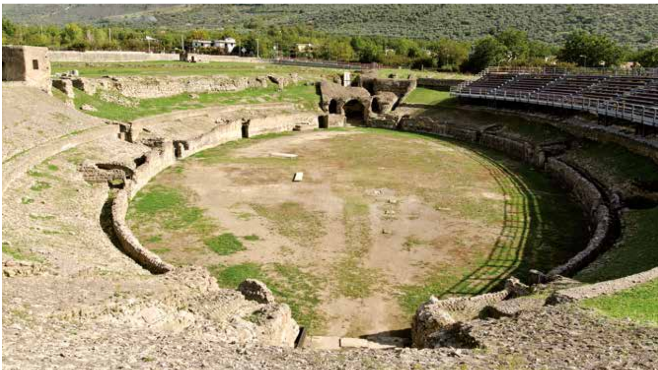
Anfiteatro di Avella

Avella, città dalle origini antichissime, sorge nell'area del Lauro-Baianese lungo la riva sinistra del fiume Clanio. Dagli Osci agli Etruschi, passando per il dominio dei Sanniti, sono tante le civiltà che hanno arricchito il passato di Avella, in particolar modo quella romana. A quest'epoca risalgono, infatti, alcune delle principali evidenze archeologiche presenti sul territorio, famoso per le sue bellezze paesaggistiche e per le produzioni agro-alimentari, tra cui si distingue quella della nocciola. Terre di Campania, in collaborazione con la Fondazione "Avella Città d'Arte", propone un'imperdibile visita didattica ad alcuni dei beni significativi dell'identità storico-culturale della cittadina e dell'intera area.