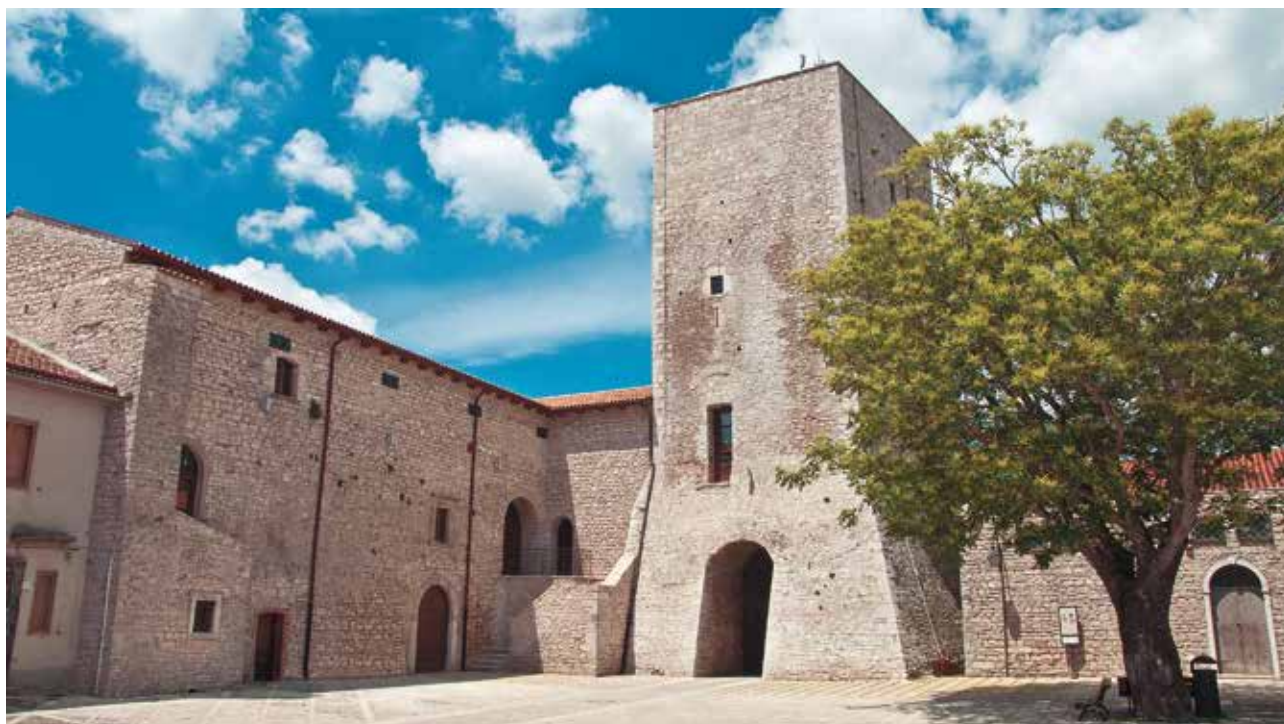
La Torre Normanna di Casalbore

Casalbore, il cui nome deriva da Casali Albuli, con riferimento alla pietra bianca locale utilizzata nelle costruzioni, sorge al confine con la provincia di Benevento, lungo il percorso del Regio Tratturo Pescasseroli-Candela. L'area è abitata sin dall'antichità, come testimoniano i preziosi reperti archeologici del Tempio Italoico (VI-V sec. a.C.), unico edificio templare di età sannitica conosciuto in Irpinia, e i resti della necropoli sannitica in Località Spineto. Nel Medioevo il borgo si sviluppò attorno alla Torre Normanna, nucleo centrale dell'apparato difensivo. Il centro storico conta la presenza di diversi edifici signorili, impreziositi da portali in pietra e finestre di ispirazione gotica. Tra gli edifici religiosi: il Monastero di Santa Maria della Misericordia, custode di una tela settecentesca raffigurante la Madonna della Misericordia tra San Domenico e altri Santi, e la Chiesa di Santa Maria dei Bossi, di epoca alto-medioevale, costruita utilizzando anche le strutture murarie di un monumento funerario risalente al II secolo d.C. Casalbore è noto anche come "il paese delle cinquanta sorgenti" per la ricchezza delle sorgenti d'acqua presenti sul suo territorio ricco di verde ed è rinomato per le produzioni tipiche, quali: i caciocavalli e i Pecorini Laticauda, prodotti con il latte dell'omonima razza ovina, una preziosa biodiversità locale, oltre che per la produzione di carni marchigiane e di salumi provenienti dai suini allevati in loco.